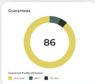
Guarantee Per Goal And Projects

Takausprosessien kokonaisvaltainen automatisointi